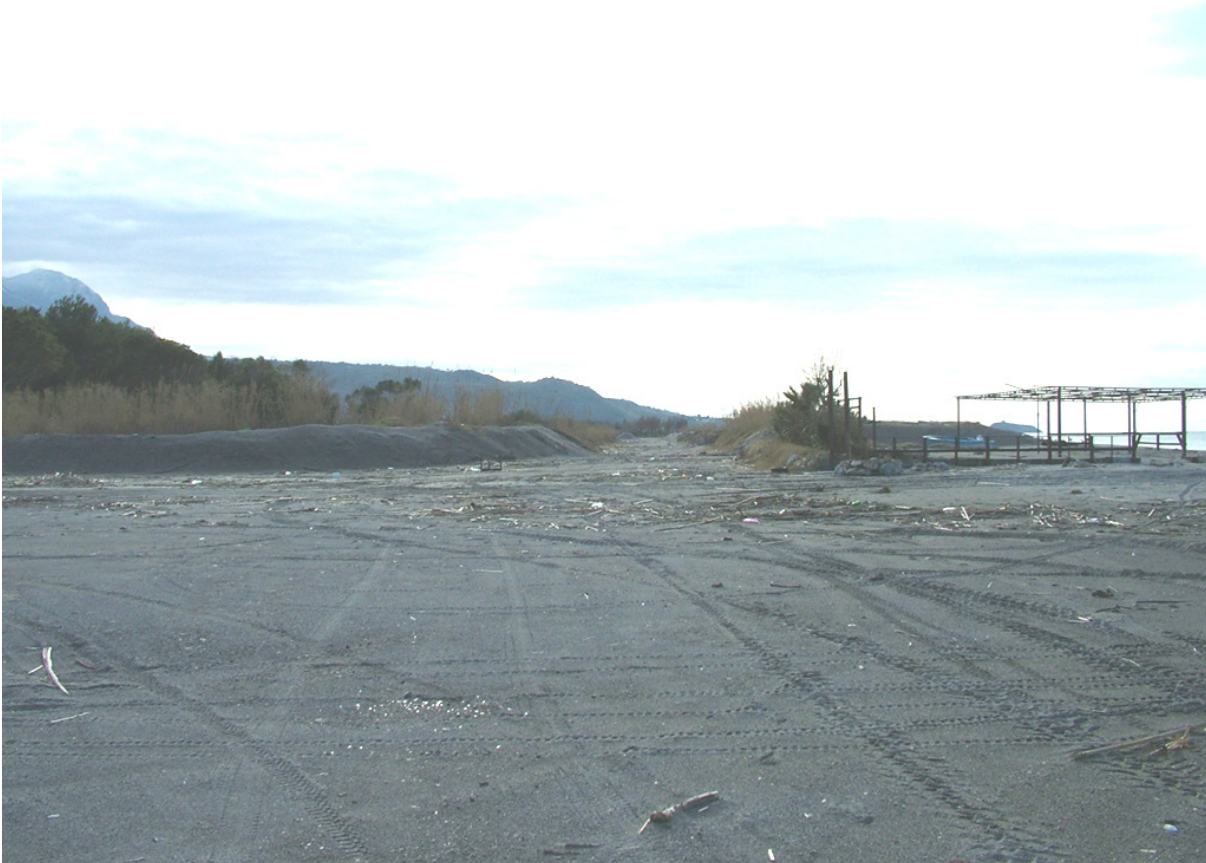
Figura 4 - Vista della viabilità al servizio dell'arenile

Per le altre aree destinate a parcheggio si farà riferimento a quelle già individuate dal vigente Piano Regolatore Generale, (non potendo il Piano comunale di Spiaggia intervenire nelle aree non demaniali ed in variante al PRG vigente).