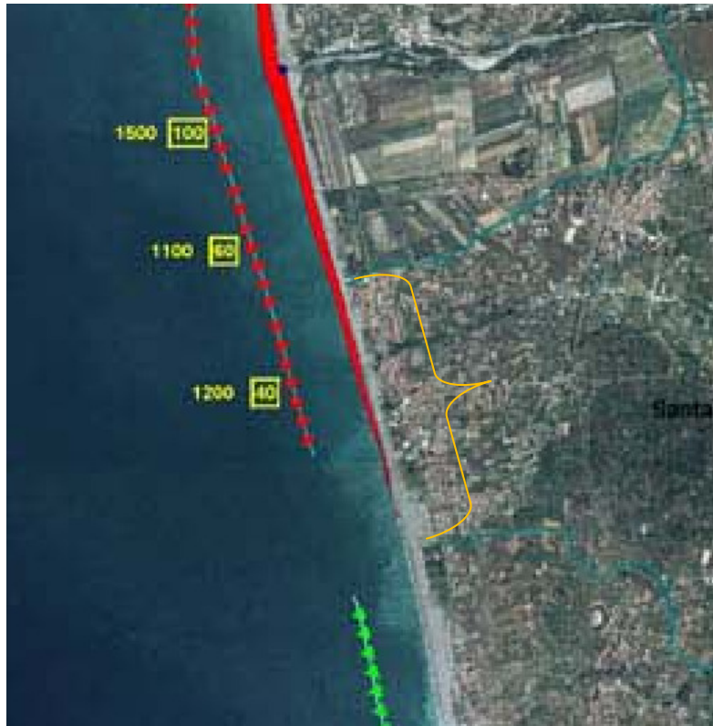
Figura 6 - Evoluzione della linea di riva