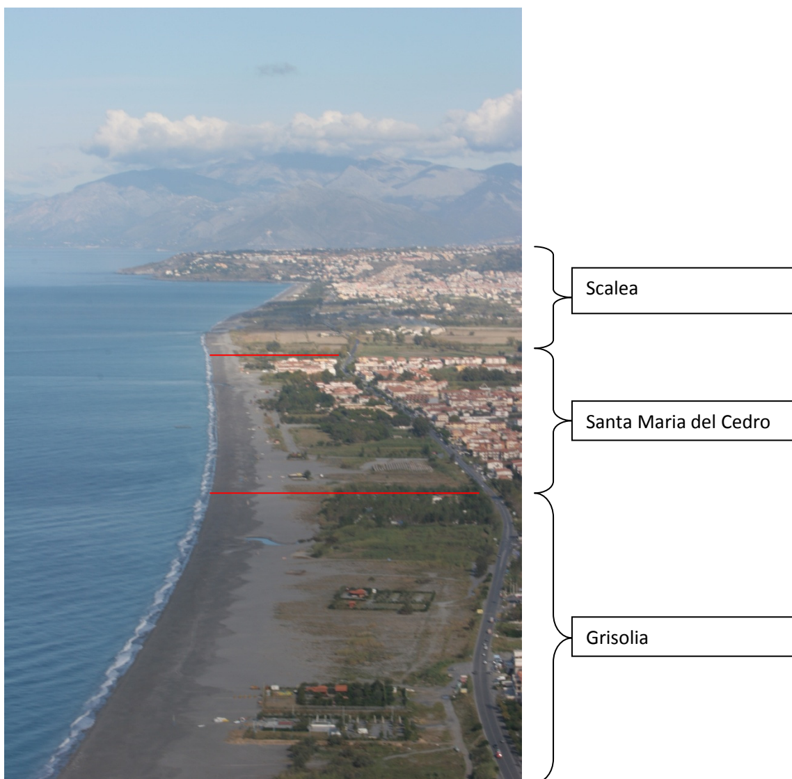
Figura 2 - Foto Panoramica Aree interessate dal PCS

comprensibile come proprio il settore del turismo costituisca una componente significativa per l'economia e lo sviluppo del territorio.