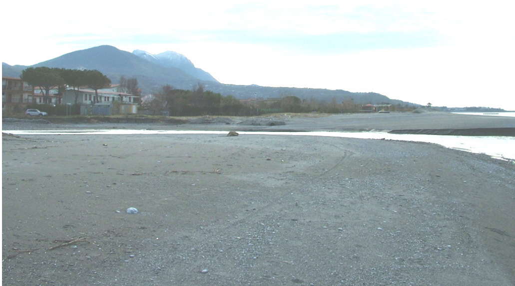
Figura 3 - Foce del Fiume Abatemarco